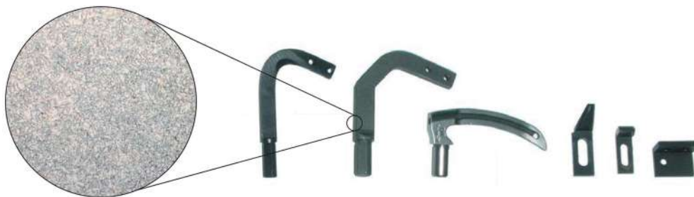
Material AISI 4317 magnified 1:370

A continuación se muestra la imagen de la microestructura de una barra estirada fabricada con material AISI 4317 magnificada 1:370. Como puede verse, la sección transversal es muy homogénea y no presenta porosidad. Este tipo de estructura hace que la pieza sea fuerte, confiable y duradera.