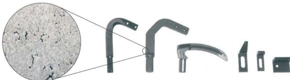
Material AISI 4317 magnified 1:370

Como puede verse, la sección transversal no es homogénea y presenta orificios y vacíos que hacen que el componente sea poco confiable.